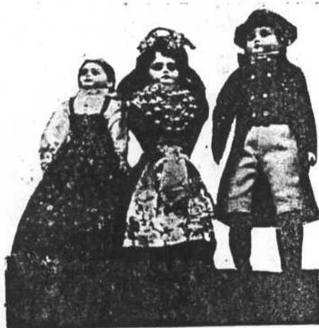
Sockendräkter från Näs

Var man ledig från »gettingen», måste man den dagen kärna smör, ysta eller koka messmör. Vispar och kvastar skulle tillverkas, löv repas och läggas till torkning. Löv var ett mjölkgivande och vitaminrikt tillskott vid utfodringen, färskt på sommaren och blandat med hackad halm och vatten vintertid. Innan färden till fäboden företogs, måste man sila upp en myckenhet söt mjölk, varav en del sat-