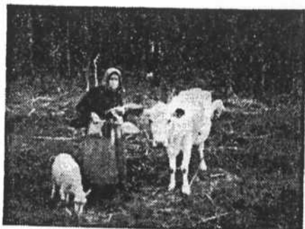
En vallkulla med stickstrumpa och slekväska vid sidan.

När kaffe pannan började medföras, beredde den en efterlängtd paus i arbetet.