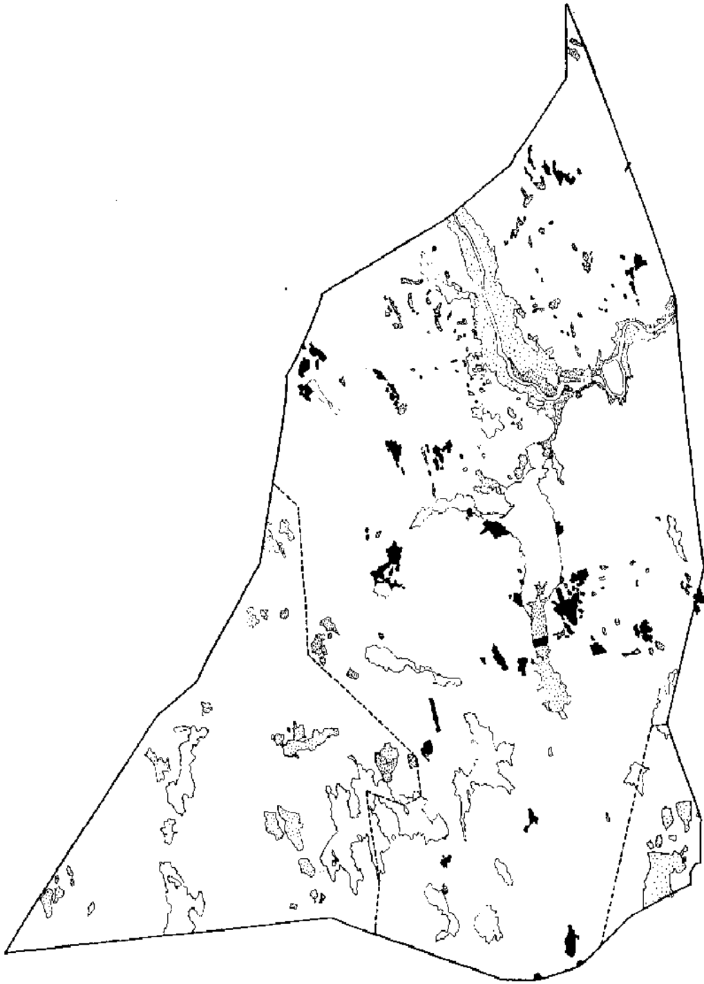
Karta 2. Näs socken vid 1800-talets början. Efter storskifteskartan LA \frac{U}{35} 112.