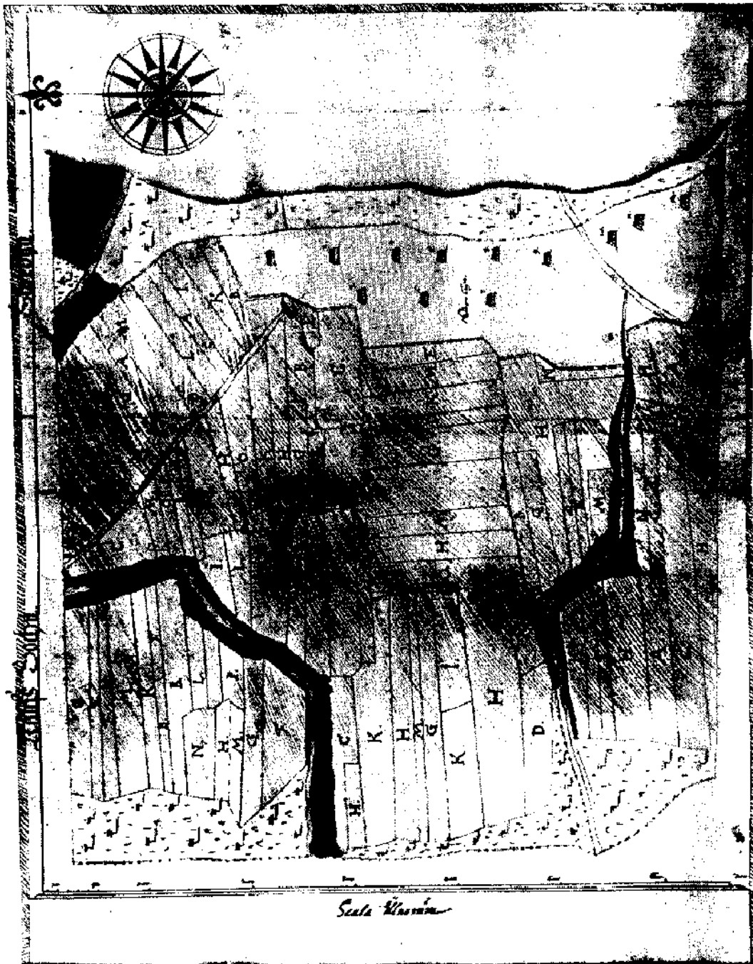
Karta 4. En del ur Storbyen enligt 1654 års karta. Efter LA U1: 137—138.

Originalets storlek 540 × 412 mm, mätt innanför ramen.